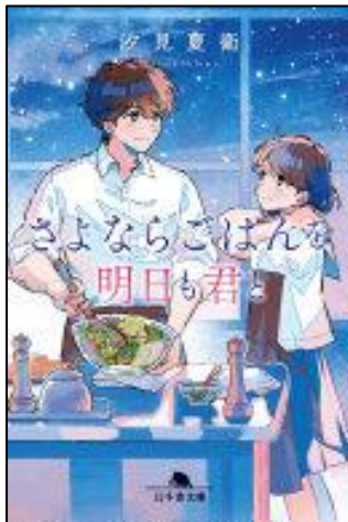
『さよならごはんを明日も君と』 汐見 夏衛/著 幻冬舎 2024.5 (YBFシ)

コアなミステリーファンにささるお話です。認知症のおじいちゃんが、孫と事件を解決する時は頭がさえわたり、「タバコを一本くれないか」の決め台詞がかっこいいです。