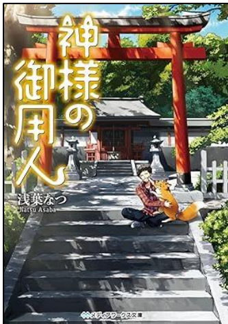
『神様の御用人』シリーズ 浅葉 なつ/著 KADOKAWA 2013.12～ (YBF ア)