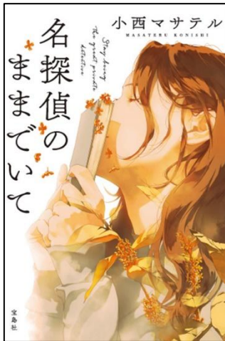
『名探偵のままでいて』 小西 マサテル/著 宝島社 2023.1 (Fコ)