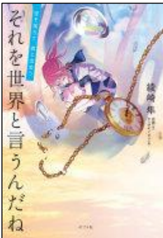
『それを世界と言うんだね 空を落ちて、君と出会う』 綾崎 隼/著 ポプラ社 2023.3 (YF ア)

神様について詳しくなれます。はじめは頼りない主人公(すでに大人)の人間的な成長や神様と人との関わり方など、ドはまりポイント満載の物語です。