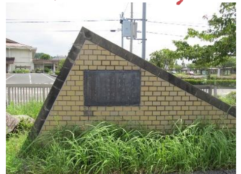
交流プラザ志摩館

まず、交流プラザ志摩館入り口の三角の建造物。小学生がよく滑り台にして遊んでいますが、実はあれが歌碑なのです。そして、道を渡った志摩中央公園内、さらには船越にある、万葉の里公園内にも。図書館に来たついでに歌碑を見るもよし、歌碑を見に来たついでに図書館に立ち寄るもよし。ご興味のある方は、ぜひ見てください。より詳しく知りたい方は、郷土コーナーにある『志摩町史』をご覧ください。